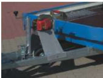
Zubehör: Seilwinde mit Windenbock und Verstellkeil auf Aluminium-Arretierblech.