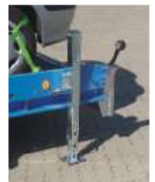
Zubehör: Teleskopstützen, mit Bolzen arretierbar, FeinEinstellung mittels Kurbel, Tragkraft 1500 kg.