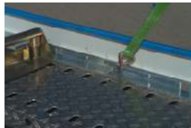
Optimale Verzerrung bei jeder Fahrzeuglänge durch