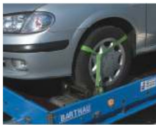
Zubehör: Verstellkeil auf Aluminium-Arretierblech.