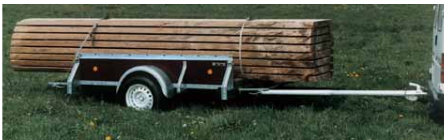
PK 751 mit Zubehör Teleskopdeichsel (nur bei PK 751 mit vorderer Klappe). Die Teleskopdeichsel lässt sich um bis zu 1300 mm ausziehen. Es sind mehrere Bohrungen zur Längenverstellung vorhanden. Je nach Kastenlänge sind folgende freien Deichsellängen (Länge von vorderer Kante Aufbau bis Mitte Kugelumkupplung) möglich: Bei Kastenlänge 2010 mm max. 2950 mm, bei Kastenlänge 2210 mm max. 2850 mm, bei Kastenlänge 2510 mm max. 2700 mm.