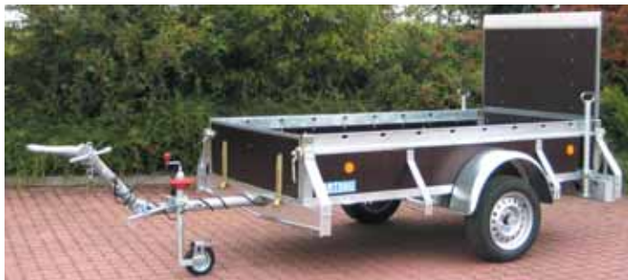
PK 751 mit Zubehör vordere Klappe, gesteckte Laderampe, Rohrstützen, Stützrad mit Feststellbremse, höhenverstellbare Zugdeichsel mit LKW-DIN-Zugöse, (Kugelumkupplung zum Wechslen möglich).