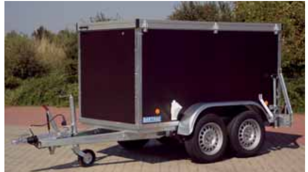
PK 2002 serienmäßig mit Zugholmen, V-Bremse und Stützrad schwer automatisch umklappbar, geschützt innerhalb der Holme montiert. Mit Zubehör Thermodeckel, Rohrstützen, Überhöhe der Bordwände rundum, hinten eine Türe.