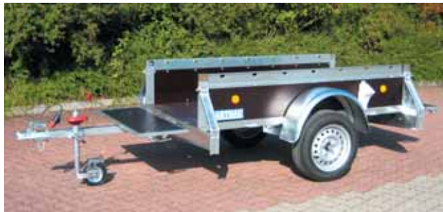
PK 751 mit Zubehör vordere Klappe, ausziehbare Deichsel um 500 mm und Stützrad leicht mit Feststellbremse, 2 Stück Unterlegkeile und Rangiergriff.