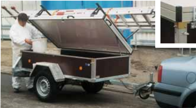
PK 1001 serienmäßig mit Vierkant-Rohrbremse und Stützrad leicht. Zubehör: Stoßdämpfer, Alu-Riffelbech-Kotflügel und Thermo-deckel mit Gasdruckfeder als Hebehilfe und mit Feststeller, Lastenträger.