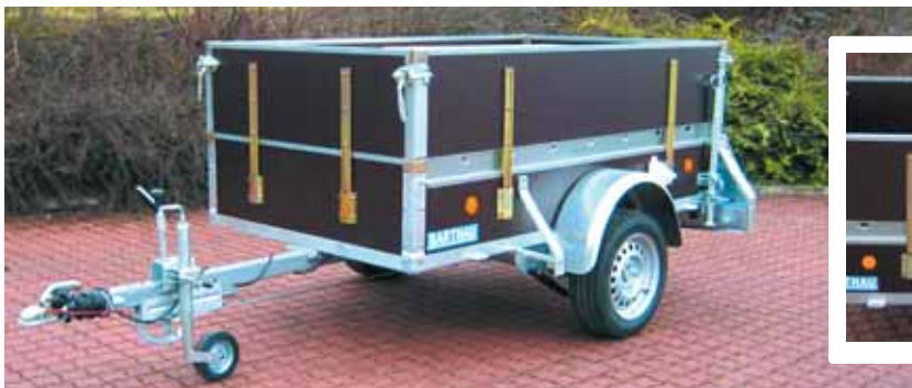
PK 1001 serienmäßig mit Rohrbremse und Stützrad leicht. Abbild. mit Zubehör: Aufsatz 400 mm hoch, Stoßdämpfern u. 2 Stück Rohrstützen hinten mit doppelter Klemmhalterung.

Aufsätze gibt es in den Höhen 400 mm und 600 mm. Die Aufsätze 800 mm gibt es nur in Verbindung mit gesteckter Laderampe. Hat der Anhänger eine vordere Klappe, so muß das Aufsteckteil vor dem Umklappen abgenommen werden.