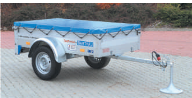
QL 751 mit Zubehör: Flachplane, serienmäßig in hellgrau, andere Farben gegen Mehrpreis lieferbar.