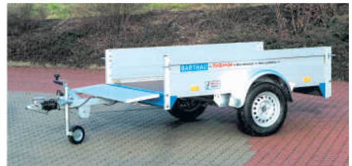
QL 1001 : Vordere und hintere Bordwand abklappbar.