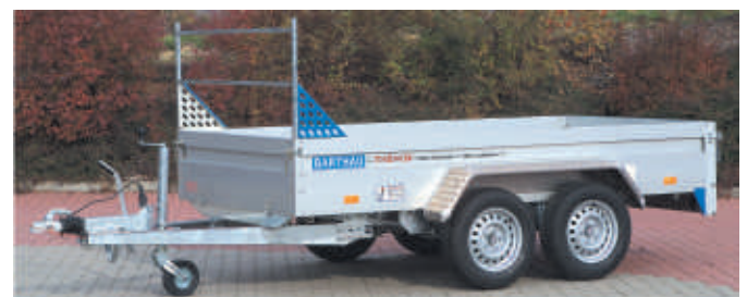
QL 2702 mit Zubehör: H-Galerie 600mm hoch gesichert mit Lochblechen gegen unbeabsichtigtes Herausziehen oder Kippen. Das obere Rohr ist drehbar gelagert und paßt sich der Ladung an. Aluminium-Riffelblechkotflügeln statt Blechkotflügeln.