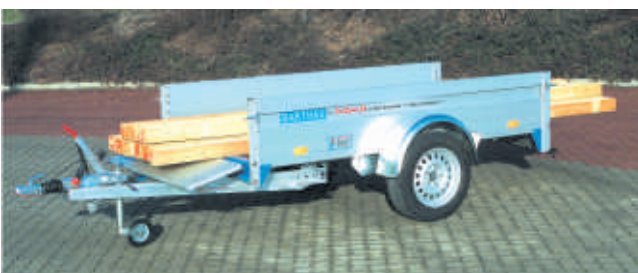
QL 1351 beladen: Vordere und hintere Bordwand abgeklappt.

Der Lastenträger ist über die Ladungssicherung TOPZURR24 befestigt und kann so kinderleicht auf- und abmontiert werden, ohne den Anhängerboden zu beschädigen. Zum Fahrradtransport ist der Fahrradträger auf den Lastenträger aufgesetzt. Maximal 5 Fahrräder finden darauf Platz.